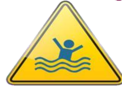
MORTALIDAD AHOGAMIENTOS, POR GRUPOS DE EDAD EN EL ESTADO DE JALISCO, AÑO 2022.